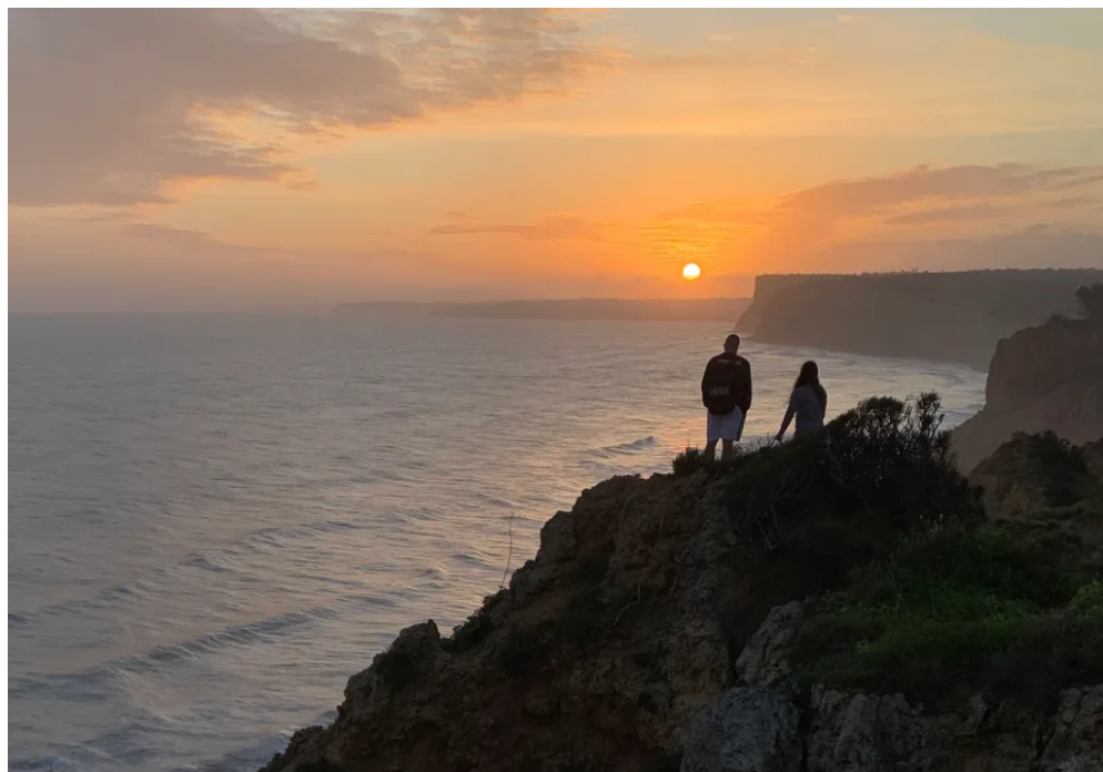
皮耶达德角以西的日落

滑鲜美真的让我服气——虽然地中海、斯堪的纳维亚和中国的海鲜我也吃过不少，但这句话我还是敢说。这趟葡萄牙之旅，眼睛和嘴巴都吃饱了。