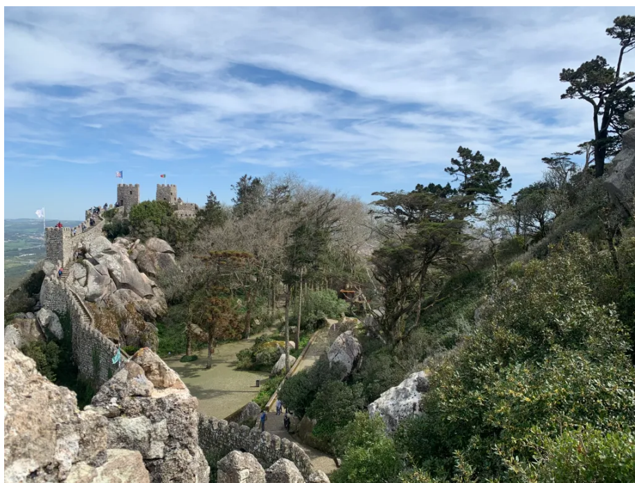
辛特拉的摩尔城堡

阿尔加维这边岩石松散又多沙，大西洋的浪打得格外猛，常年侵蚀在海岸线上留下了天然石拱、海蚀洞和细沙滩，一道道痕迹都很永久。阿尔加维的海滩绝对算得上欧洲最美之列：有的窄得只能算是夹在两片垂直崖壁之间的一条缝，得沿着陡峭的台阶才能下去。不过一旦下去了，那就是望海发呆、踏浪玩水的天堂。三月的海水还是又冷又汹涌，但正好适合坐在那儿什么也不干。