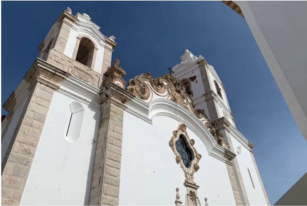
拉各斯一座葡萄牙巴洛克风格的白色教堂立面

后来经历了西班牙短暂吞并，又经历了一段独裁时期，葡萄牙到20世纪70年代才成了现代共和国。如今，气候宜人、生活成本不高、风景又美，再加上正好处在欧洲、非洲和美洲的交界处，葡萄牙正在变成增长最快的旅游和退休目的地之一。我觉得，它的未来挺光明的。