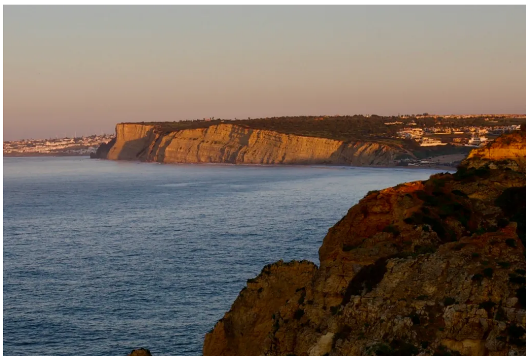
从皮耶达德角向西望去的日出

清晨阳光下，多纳安娜海滩那片金色沙滩和金色崖壁，已经刻进我对阿尔加维最深的记忆里了。在这儿待的三个晚上，每天早上沿海滩散步成了固定节目，晚饭后沿着悬崖木栈道走到皮耶达德角看日落，则是最享受的一段时光。