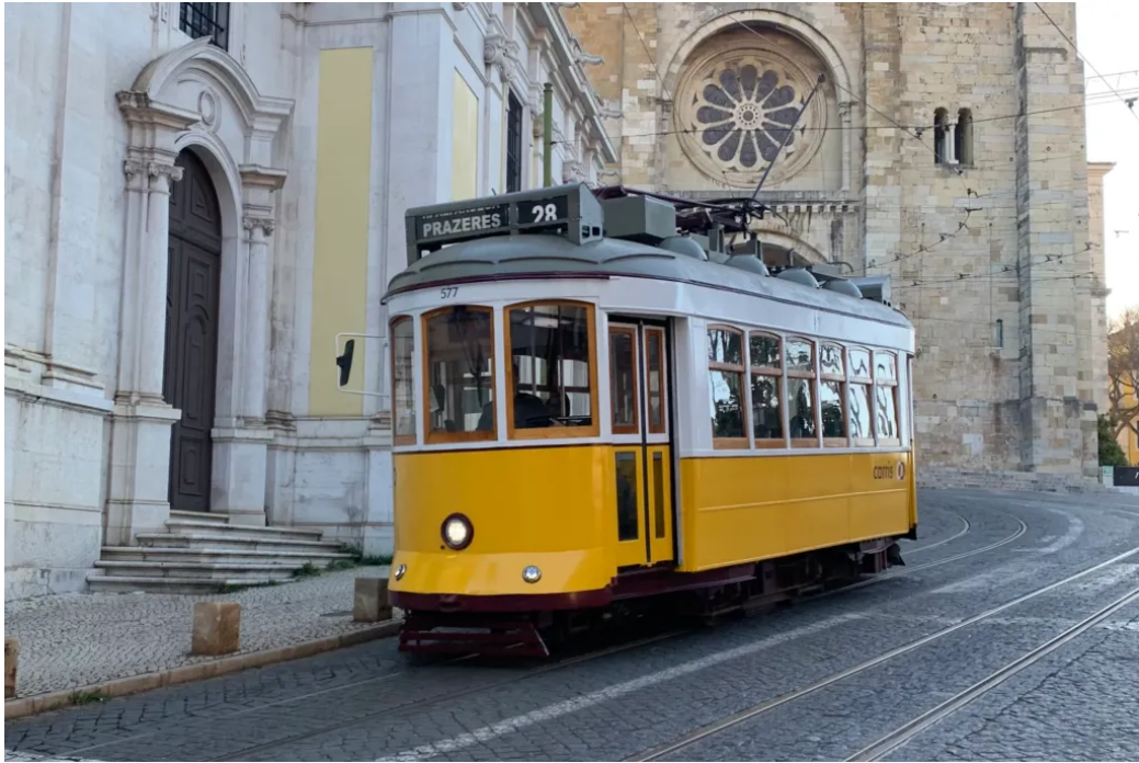
里斯本鹅卵石街道上的经典有轨电车

如果说起伏的地形和窄巷子是我对里斯本的印象，那嶙峋的悬崖和金色沙滩就是阿尔加维留给我的记忆。天然石拱在这儿太常见了——几乎每个观景台望过去都能看到一两个。多纳安娜海滩以西那段悬崖短途走下来，我都习惯了随时能撞见一处石拱。