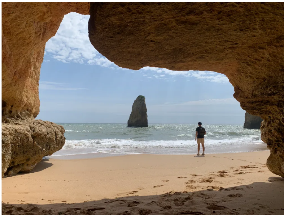
卡沃埃罗角附近卡瓦略海滩的洞穴

要说多纳安娜海滩周边的悬崖已经够震撼了，那马里尼亚海滩这一带只能说有过之而无不及。从海滩走到卡沃埃罗角的小路很轻松，一路能看到不少海滩、石拱、洞穴和天坑。要是在阿尔加维只能挑一天出来走，那就走这条路。