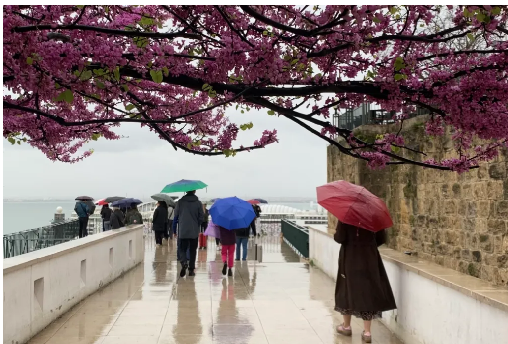
里斯本太阳门观景台的雨天

一大早到里斯本，打车去市中心，先把行李寄存在青年旅社好腾出手来，等着租的公寓开门。我们住的地方离商业广场就几个街区，走着就能到里斯本所有主要景点。