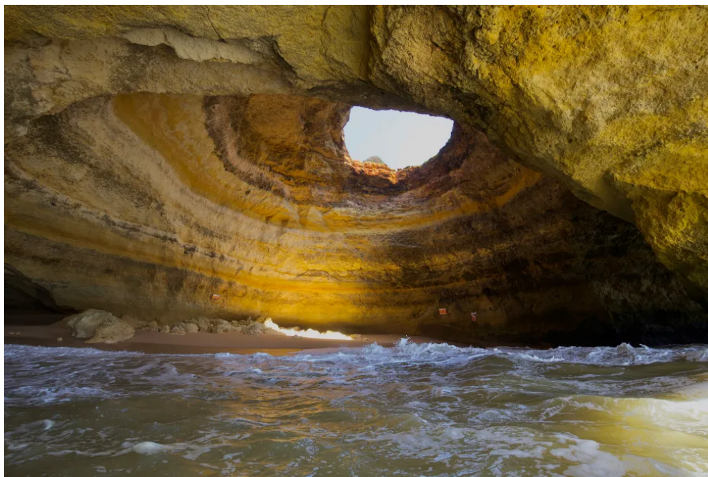
贝纳吉尔洞穴内部

行程结束后，在镇中心那家叫百比诺（Balbino）的辣椒烤鸡餐厅坐了一会儿，正好抚平了颠簸游船之旅带来的疲惫。那只烤鸡是整趟旅程里最鲜嫩多汁的一道菜，没有之一。