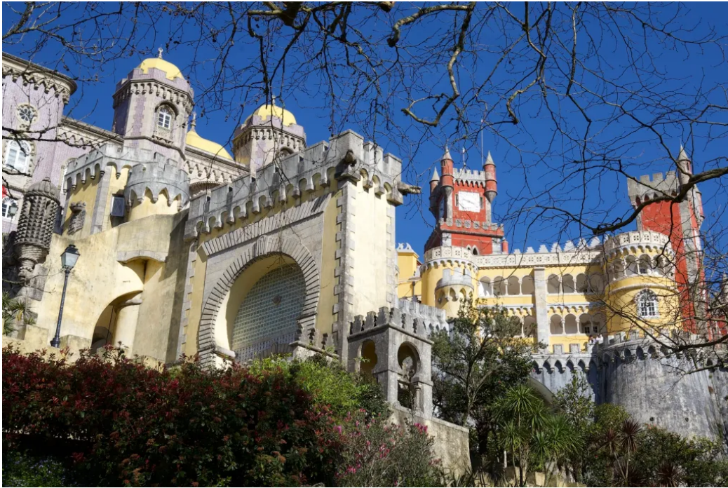
佩纳宫与摩尔式拱门

相比之下，离宫殿一两英里外的摩尔城堡遗址就安静多了。光是从佩纳宫沿着蜿蜒小路穿过古树林、安安静静走下山到摩尔城堡这一段，就已经值得专门跑一趟辛特拉了。在城堡墙头走走，或者坐在石铺庭院里的老树荫下发发呆，想想文明的碰撞与融合，感觉都挺特别的。