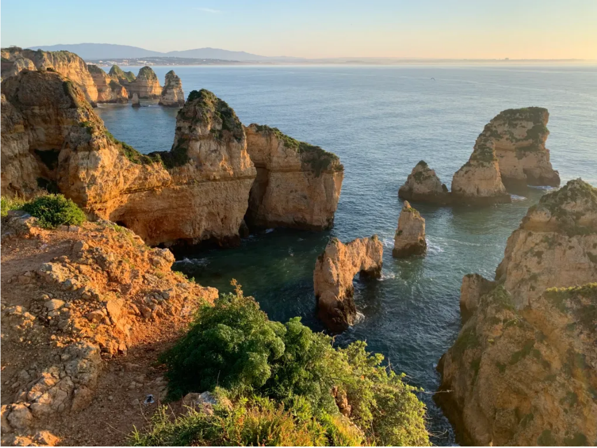
阿尔加维海岸，卡米洛海滩附近