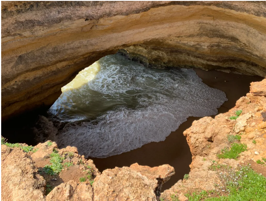
俯瞰贝纳吉尔洞穴

这趟旅程的收尾，是从阿尔马桑德佩拉出发去贝纳吉尔洞穴的一趟游船。贝纳吉尔洞穴算是阿尔加维最有代表性的地标了。那天海况不太好，本来订好的皮划艇之旅被取消了，经营者临时给我们安排了游船替代，不过锯齿状海岸线每转一个弯都是美景，一切都值了。