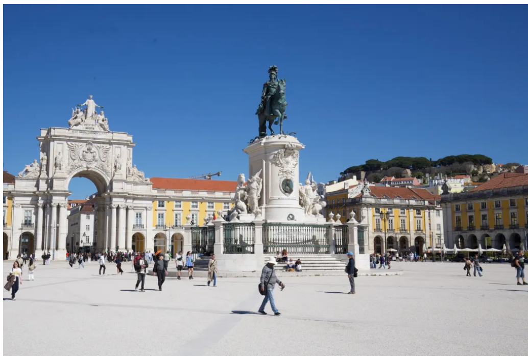
里斯本标志性地标——商业广场

走到圣卢西亚观景台看了看城市全景，顺便尝了尝葡萄牙国民甜点蛋挞（pastel de nata）。接着沿山往上走，爬到圣乔治城堡——市区最高点，整座城市尽收眼底。下山后又晃到商业广场，里斯本滨水区最标志性的地方。