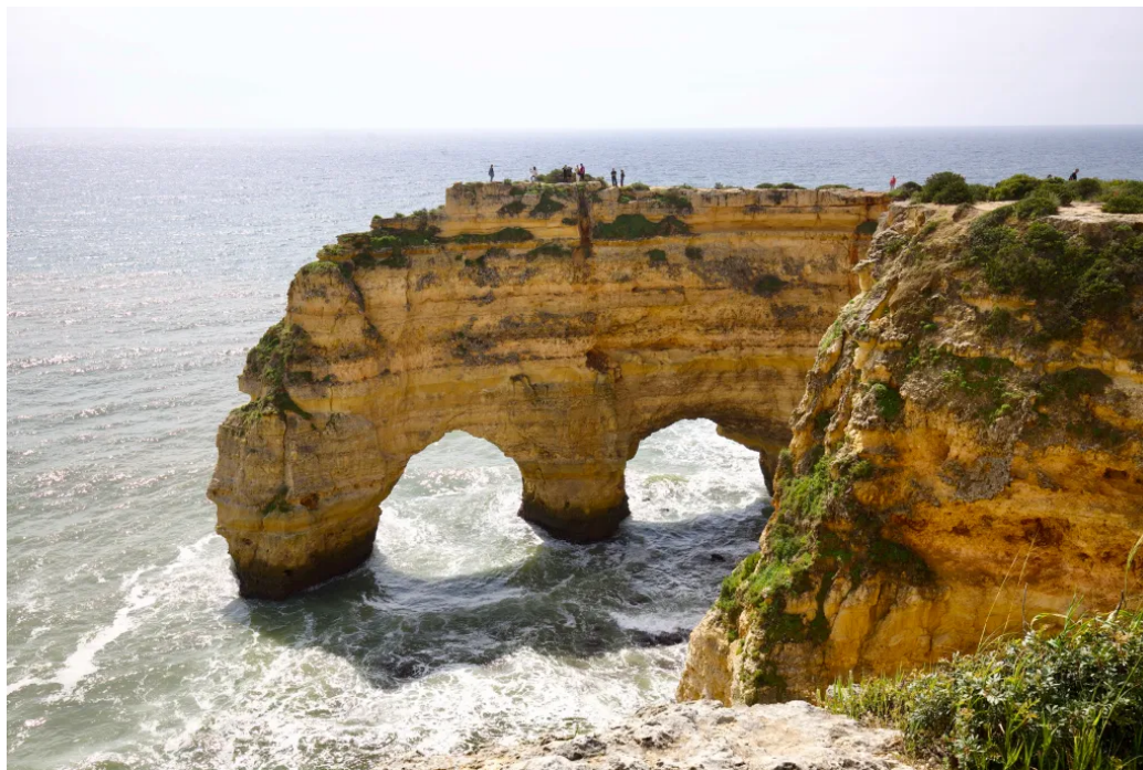
马里尼亚海滩以西的天然石拱

好多海滩的入口已经封了，木栈道被海浪冲垮，海滩本身也被侵蚀得不成样子。地方是还在那儿，我们总以为以后有的是时间，钱也攒得够了再去，可地方会变，我们自己也会变。我可不想哪天走到海滩入口发现它已永久关闭了，也不想哪天发现自己的膝盖爬不动那些台阶了，更不想因为人太多而扫兴而归。现在，永远是做一件事最好的时候。