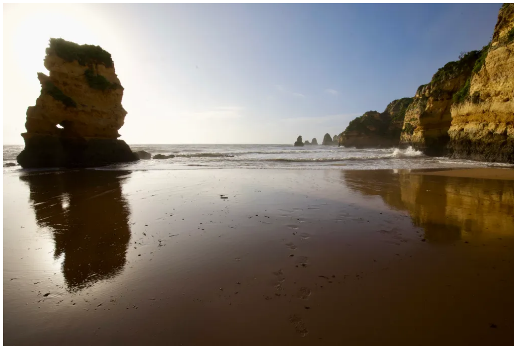
清晨的多纳安娜海滩

清晨阳光下，多纳安娜海滩那片金色沙滩和金色崖壁，已经刻进我对阿尔加维最深的记忆里了。在这儿待的三个晚上，每天早上沿海滩散步成了固定节目，晚饭后沿着悬崖木栈道走到皮耶达德角看日落，则是最享受的一段时光。